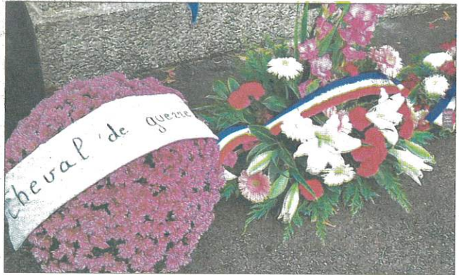
Ce chrysanthème côtoie les trois gerbes déposées lors de la cérémonie du 11-Novembre.

Vers 12 h 30, après le départ du public et des autorités, une femme que personne ne connaît s'est approchée du monument aux morts et a déposé un grand chrysanthème avec un large bandeau "Cheval de guerre". Est-ce en souvenir des nombreux chevaux disparus pendant le